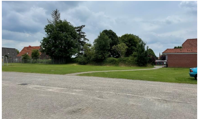
Abb. 3: Blick Richtung Wall

Auf der gegenüberliegenden Seite des Dorfplatzes an der östlichen Grenze wird ebenfalls ein Staudenhochbeet mit Sitzelementen geplant. Durch die Ausformung der Hochbeete entstehen kleine Nischen, die den Dorfplatz gliedern. An der östlichen Grenze wird dieser Raum für eine neue Grillecke genutzt. Durch die hohe Sichtschutzhecke von ca. 2,00 m wird der Dorfplatz gefasst und eine Abgrenzung zu den Sportplätzen geschaffen. Angrenzend an das Staudenhochbeet im Norden werden Sport- und Spielgeräte für Erwachsene installiert. Ein kleiner Bewegungsparcour bietet die Möglichkeit sozialer Begegnung und damit die aktive Teilhabe am Leben in einer Gemeinschaft. Gleichzeitig wird unabhängig von Alter, individuellen Ambitionen und Trainingsstand die Möglichkeit sportlicher Aktivität und somit Prävention geboten. Ferner handelt es sich um Allwettergeräte, die auch bei widrigen Bedingungen gefahrlos genutzt werden können. Mit dem Bewegungsparcour wird auch ein Übergang zu den im Norden vorhandenen Sportnutzungen geschaffen. Auch der neue Skater & Streetball Bereich soll das sportliche Angebot erweitern und zusätzliche Nutzergruppen ansprechen.