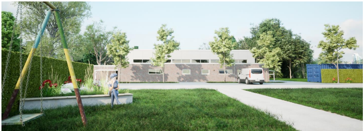
Abb. 5: Visualisierung: Blick vom Spielplatz Richtung Sporthalle

Durch die Umgestaltung des Dorfplatzes wird die Lebensqualität im ländlichen Raum verbessert. Der Platz lädt zum gemeinsamen Verweilen und Spielen ein. Da ein Dorfgebiet nicht nur durch seine bauliche Gestaltung, sondern auch durch ein aktives gesellschaftliches Leben der Bevölkerung geprägt wird, sind Orte des Aufeinandertreffens von besonderer Bedeutung. Aus diesem Grund wird u.a. der Grillplatz angelegt und kann als Ort der Begegnung genutzt werden. Dies gilt ebenso für den Mehrgenerationenspielbereich, der sich durch multifunktionale Geräte zum Spielen und für die sportliche Nutzung auszeichnet und Altersgrenzen verschmelzen lässt. Aus diesem Grund verfügt die vorliegende Maßnahme über eine hohe soziale und kulturelle Bedeutung, da der Dorfplatz zum generationenübergreifenden Zusammenkommen und Verweilen einlädt. Zusätzlich werden in der Gestaltung auch die Ziele des Natur- und Klimaschutzes in einem besonders hohen Maße berücksichtigt.