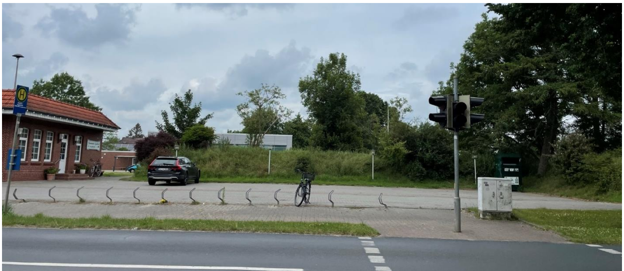
Abb. 1: Blick auf den Parkplatz des Gasthofes von der Hauptstraße