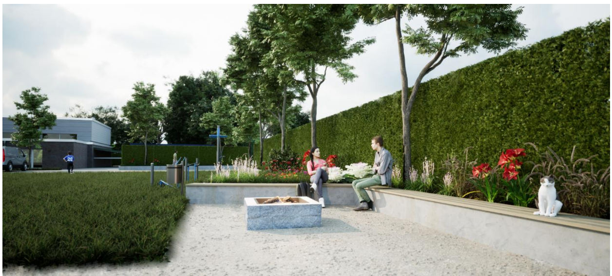
Abb. 6: Visualisierung: Blick vom Pavillon Richtung Grillplatz