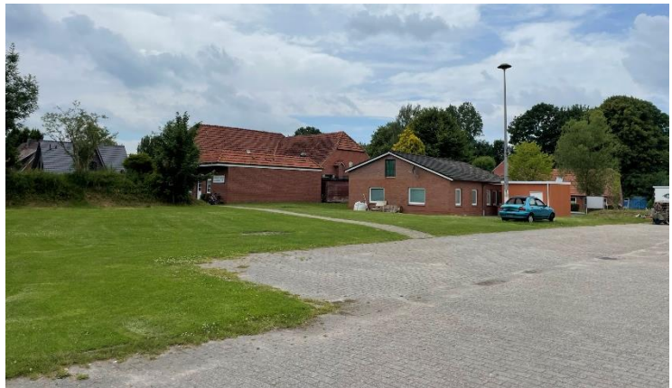
Abb. 2: Blick auf den Gasthof und die Feuerwehr

Um den bestehenden Gasthof zu stärken und auch den Dorfplatz zu beleben, entsteht angrenzend an den Gasthof eine neue Holzterrasse, die für die Außengastronomie genutzt werden soll. Daran angrenzend entsteht ein Spielplatz für Kinder. So haben Besucher mit Kindern die Möglichkeit, im Außenbereich der Gastronomie zu sitzen und trotzdem ihre Kinder im Blick zu behalten. Im Spielplatzbereich werden Bäume gepflanzt, damit auch zur Mittagszeit das Spielen im Schatten möglich ist.