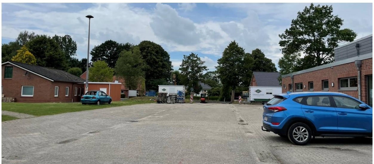
Abb. 4: Blick Richtung Eingang von der Hauptwieke

Der zweite Eingang zum Dorfplatz erfolgt von der Straße Hauptwieke, von der auch die Sporthalle erschlossen wird. Im Bereich der im Jahr 2016 sanierten Sporthalle wird auf dem Parkplatz neue Sickerbeete mit Bäumen angelegt. Das anfallende Oberflächenwasser des Parkplatzes wird in die neuen Sicker- und Pflanzbeeten geleitet und versickert somit vor Ort. Damit soll ein Beitrag zur lokalen Versickerung und zur Wiederverwendung von Oberflächenwasser geleistet werden.